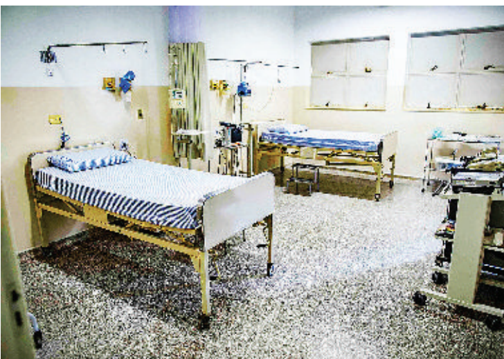
ARAÇATUBA O Hospital Municipal não é aberto ao público

A Secretaria de Saúde colocou em funcionamento o Hospital Municipal (HM) para atendimento de pacientes com covid-19. Local funcionará como apoio à Rede de Urgência e Emergência, como Pronto Socorro Municipal e Santa Casa.