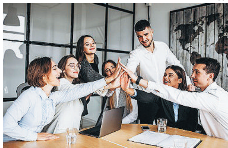
NEGÓCIOS Melhores práticas e resultados alinhadas ao conceito

“Essas empresas tornam o mundo melhor pela maneira co-