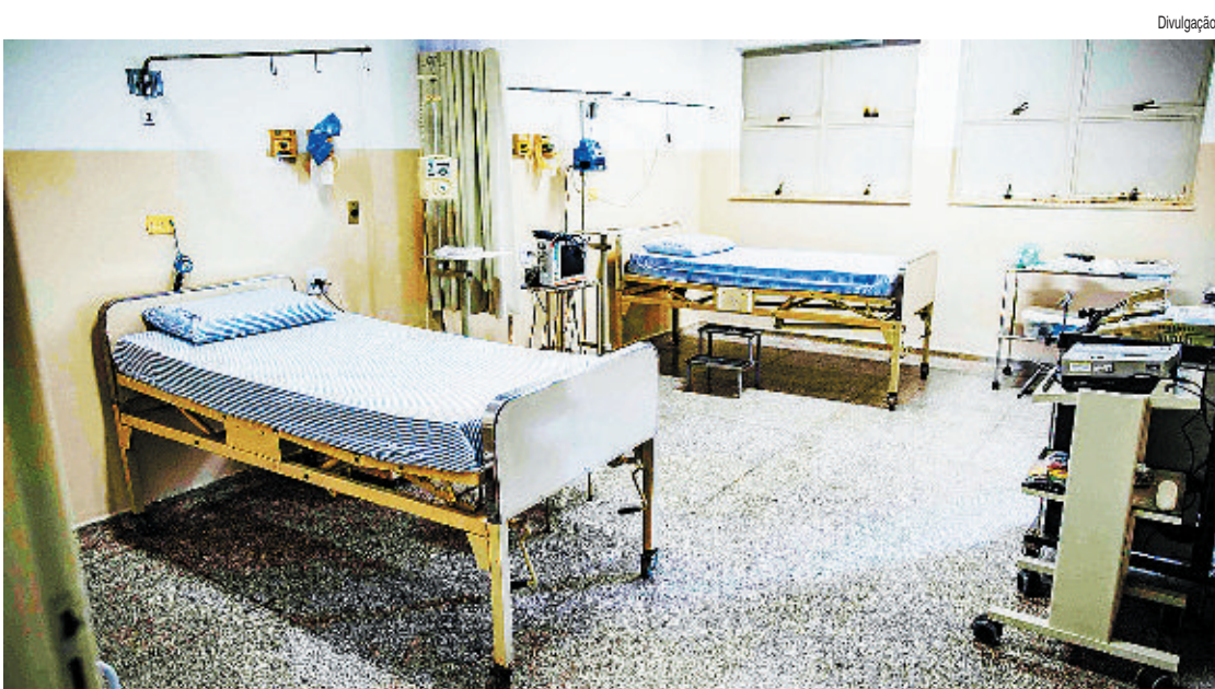
ARAÇATUBA Hospital Municipal passou por adequações estruturais, manutenção de equipamentos, entre outros

O Hospital Municipal conta, inicialmente, com 10 leitos para atendimento a pacientes com casos leves de Covid-19. No entanto, a Secretaria Municipal de Saúde protocolou junto ao Governo