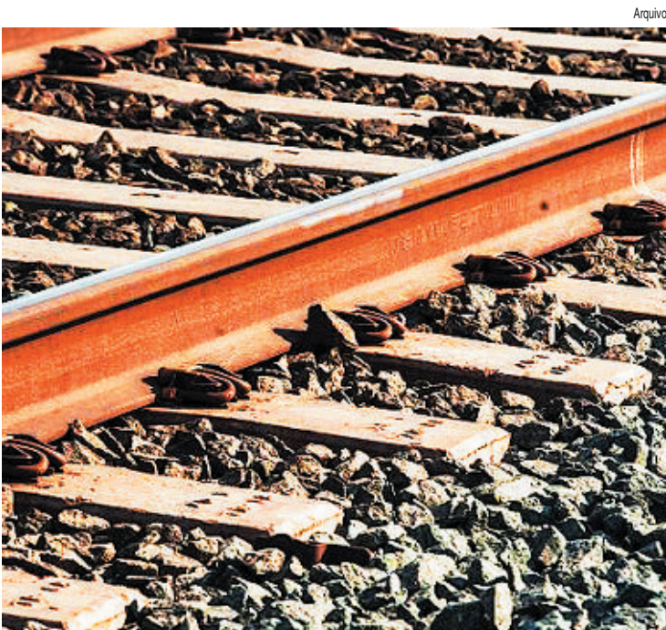
MALHA OESTE Ferrovia que corta a região foi devolvida pela Rumo